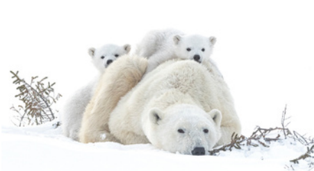
1er : Bruno et Dorota SENECHAL, Sevrier (74)

14 membres ont voté pour élire le “Prix du Jury” et les 18 photographes qui verront leur photo “phare” (1,2 m x 0,8 m) exposée pendant les 3 jours du Festival Sologne Nature Image, à l'Office de Tourisme de Sologne, partenaire du Festival.